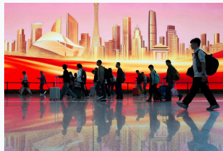
Tải lên từ máy

N hững trung tâm kinh tế lớn tại Trung Quốc đang bước vào giai đoạn cạnh tranh ngày càng rõ nét nhằm giành vị thế dẫn đầu về đổi mới sáng tạo và công nghệ cao, trong bối cảnh